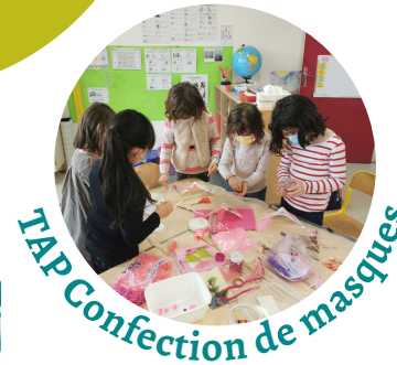
TAP Confection de masques

Merci de retourner les dossiers d'inscription directement en mairie.