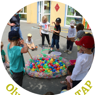
Olympiades des TAP